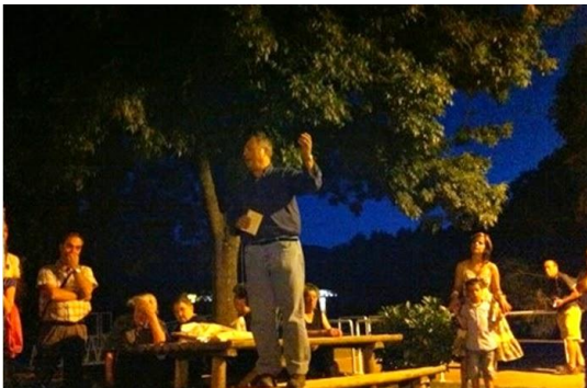
Conto de histórias ao ar livre.