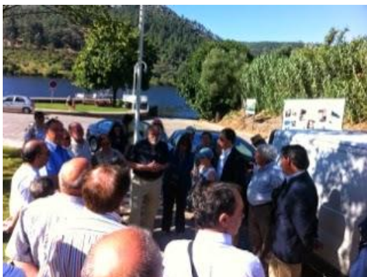
Homenagem à “Geração do Tejo”.

Entre as várias atividades, destaca-se uma sessão de cinema, em que os presentes foram convidados a testemunhar um “documento histórico” da década de 70 do século passado, mostrando a intervenção dos arqueólogos no estudo das gravuras rupestres, posteriormente submersas pela construção da barragem do Fratel, assim como a sessão de conto de histórias ao ar livre numa noite de lua cheia junto ao Rio Tejo.